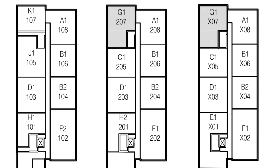
Rez-de-chaussée Niveaux 2 Niveaux 3 @ 6