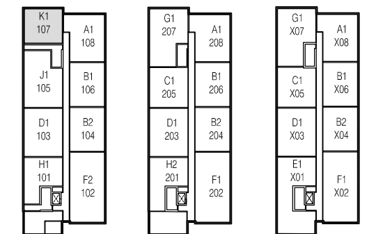
Rez-de-chaussée Niveau 2 Niveaux 3 @ 6